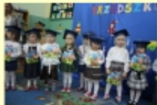
Pasowanie na Przedszkolaka