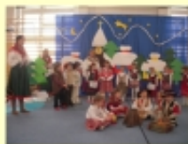
Podsumowanie projektu edukacyjnego Dobry start