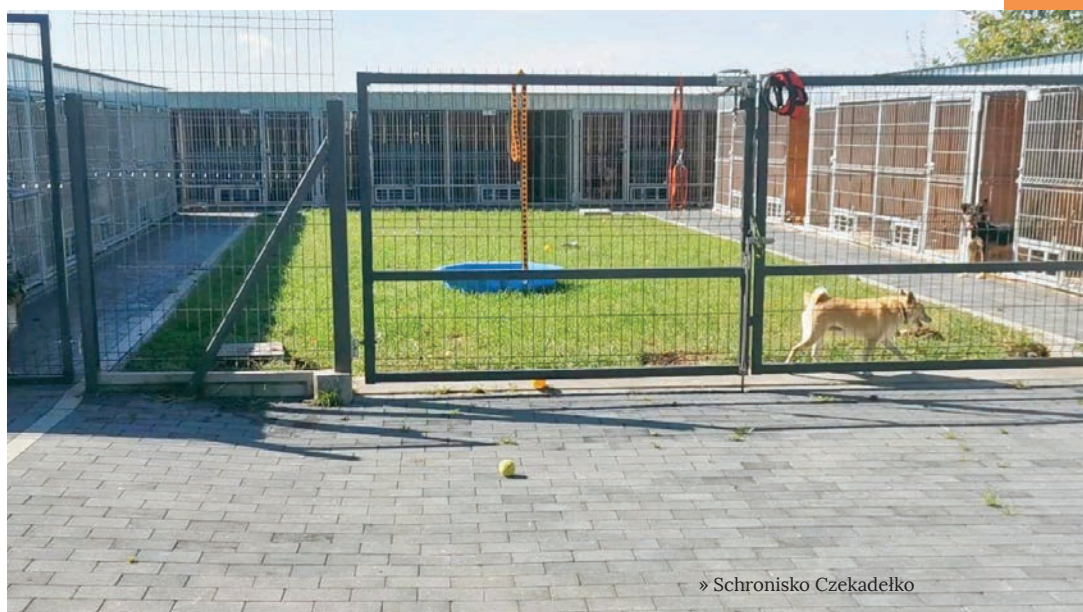
» Schronisko Czekadelko

Zaznaczyć należy, że koszty, jakie ponosi Gmina w związku z oddaniem bezdomnego psa do schroniska, są bardzo wysokie. Jednorazowa opłata w 2020 roku to 1 900 zł netto za psa lub kota oddanego do schroniska, a w przypadku konieczności wyłapania i transportu psa koszty wzrastają o dodatkowe 400 zł. Przyjmujemy i weryfikujemy każde zgłoszenie dotyczące bezdomnych zwierząt i w przypadku potwierdzenia, że jest to zwierzę bezdomne, zlecamy jego wyłapanie i przekazanie do schroniska. Mając na uwadze koszty, jakie Gmina ponosi w związku z opieką nad zwierzętami bezdomnymi, apelujemy o odpowiedzialne zajęcie się posiadanyimi zwierzętami. Pamiętajmy, aby nie pozostawiać zwierząt bez opieki, zapewnić im godne warunki bytowania. Zachęcamy do podejmowania działań takich jak kastracja czy sterylizacja czworonogów, do których to zabiegów można uzyskać w Gminie dofinansowanie.