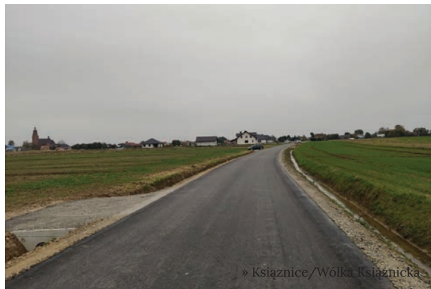
» Książnice/Wólka Książnicka

W październiku Wójt Gminy Mielec Józef Piątek oraz Zastępca Wójta Tomasz Ortyl przy udziale wykonawcy robót dokonali odbioru kolejnej inwestycji drogowej dotyczącej remontu drogi gminnej Książnice –Wólka Książnicka (Niemiecka). Na odcinku ponad 1,3 km istniejącą nawierzchnię z kruszywa zastąpiła nawierzchnia bitumiczna, zostały odmulone rowy oraz przebudowane przepusty. Łączna wartość zadania to 833 141,80 zł brutto w tym 75% stanowi dofinansowanie z Funduszu Dróg Samorządowych.